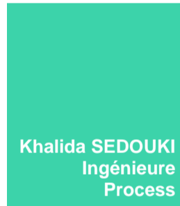
Khalida SEDOUKI Ingénieure Process